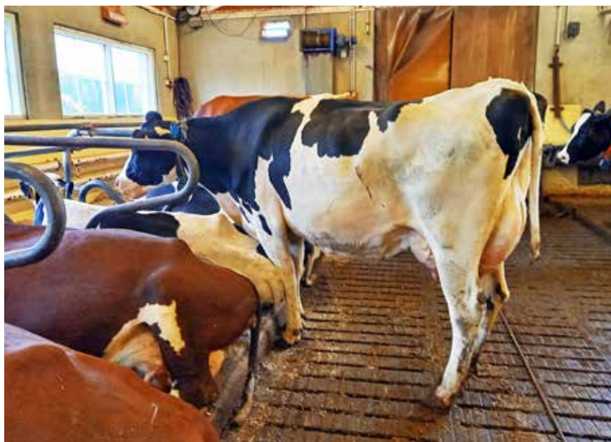
Kiiman merkit voivat olla hyvin pieniä kuten tässä, kiimainen lehmä nojailee toiseen makaavaan lehmään. Pienten merkien havaitseminen edellyttää aikaa tarkkailuun.